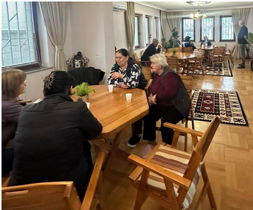
Figuur 1 Ouderen eten in gerenoveerd Day Care Center

Voorzitter Stichting De Brug Internationaal